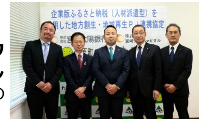
人材派遣に係る連携協定式