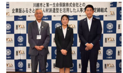
人材派遣に係る協定式 (川越市)