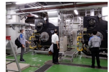
県有施設のエネルギーシフト (派遣元企業による調査)