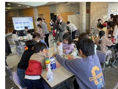
大学生が企画した探究型学習プログラム