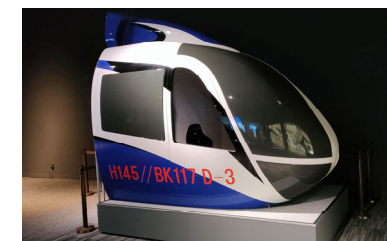
博物館内に設置したVRヘリシミュレータ