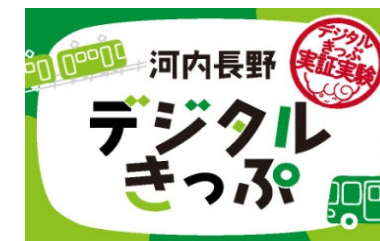
市内鉄道・バス共通1日乗車券「河内長野デジタルきっぷ」