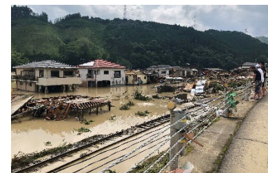
濁流により壊滅した家屋