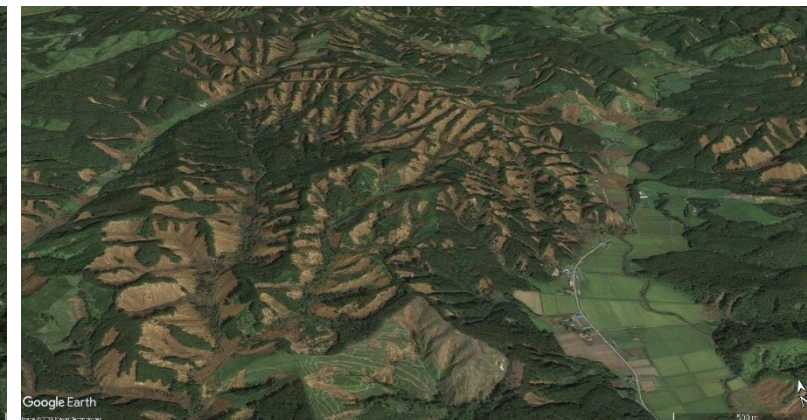
平成30年9月撮影 (発災後)