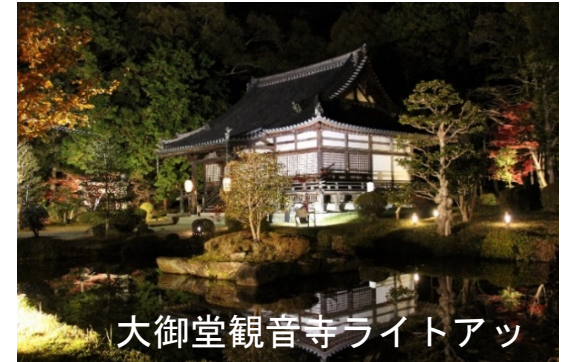
大御堂観音寺ライトアップ