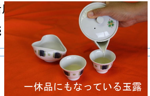
一休品にもなっている玉露