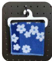
えひめ脱プラプロジェクト展示商談会 カタログ (大王製紙 (株))