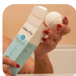
The honey pot