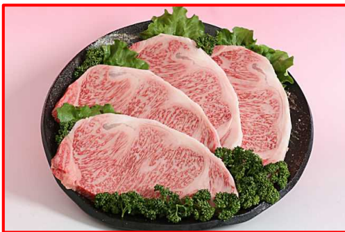
曾於市産の黒毛和牛