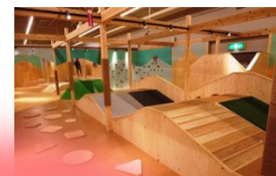
導入する施設【室内施設等】