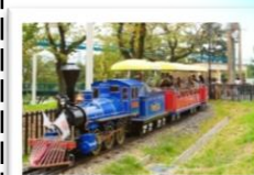
のこす施設【大型遊具】