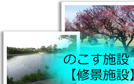
のこす施設【修景施設】