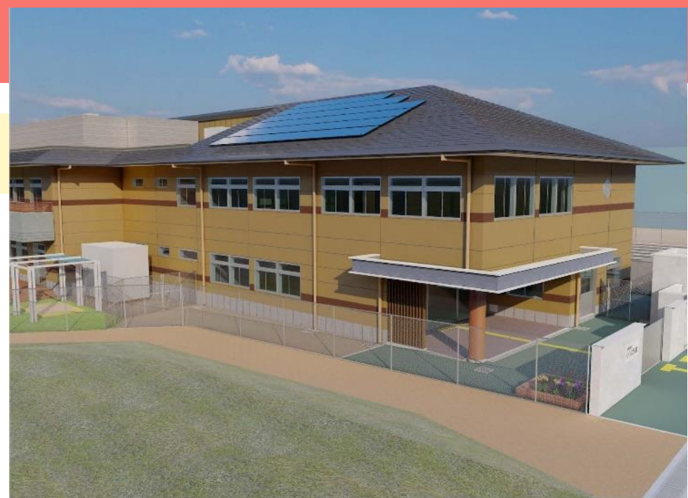
(仮称) 大住こども園完成予定図