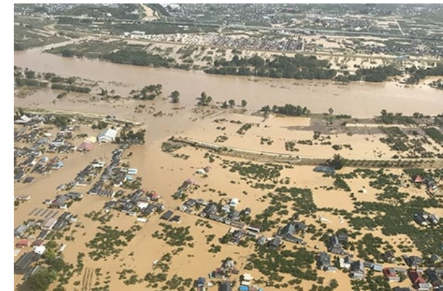
長野市穂保（千曲川堤防決壊箇所）

こうした経験・教訓を基に、 平時から災害にそなえ、防災を学び、適時適切な避難行動を支援するためのアプリを開発！