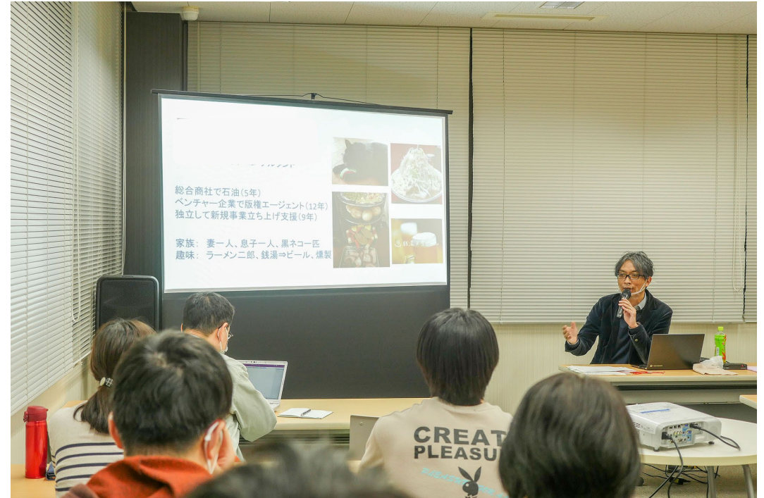
社会の多様性に応じたキャリア形成【セミナー】講師の様子

人材不足が深刻なIT業界において、高スキルで意識の高い人材の獲得と教育は課題！会社としても力を入れており、強い関心。