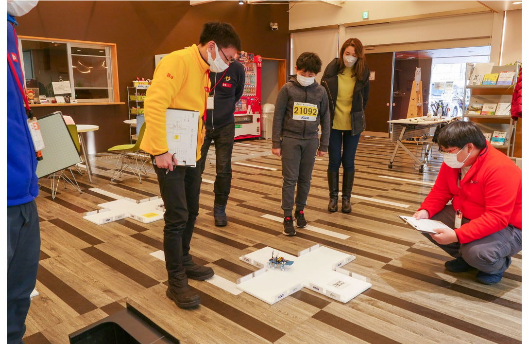
プログラミングでロボットを動かそう！【全5回】運営補助の様子

事業を通して他企業や人と繋がること、優秀な受講者と繋がる ことがメリットに。また、人材輩出というスケールに強い共感。