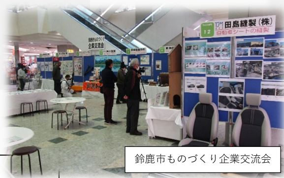
鈴鹿市ものづくり企業交流会