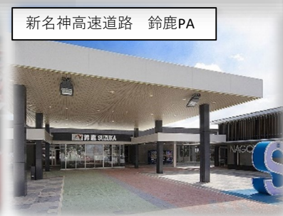
新名神高速道路 鈴鹿PA

～既存産業の基盤強化～ ものづくり技術力の強化 ニーズの多様化・SDGsへの対応