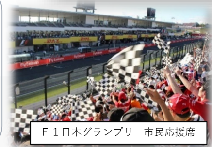
F1日本グランプリ 市民応援席