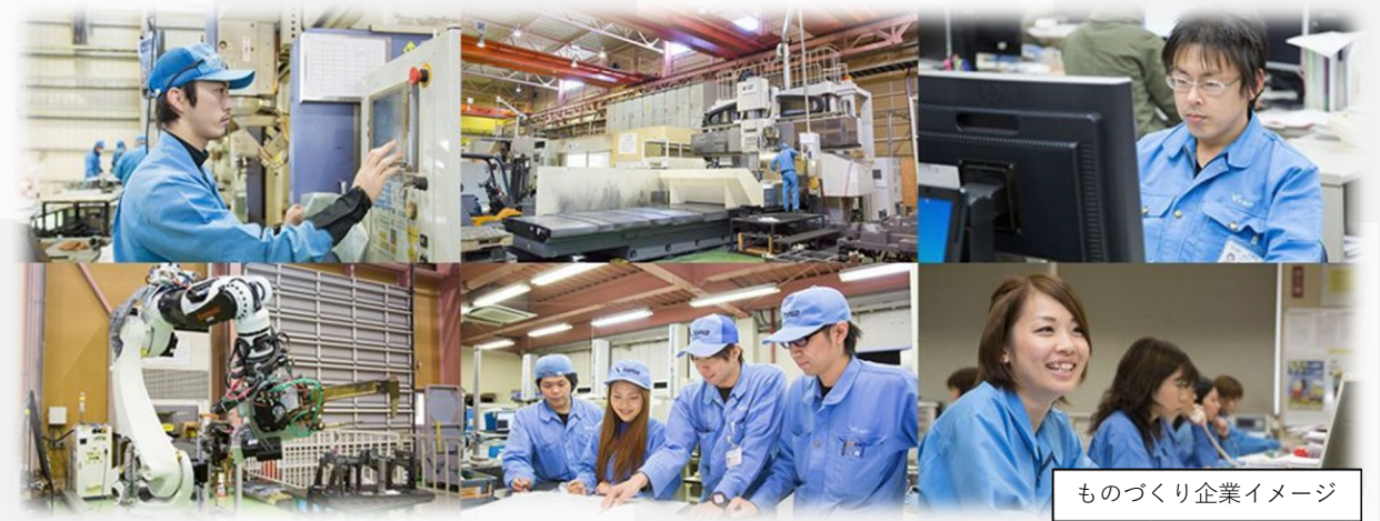
ものづくり企業イメージ