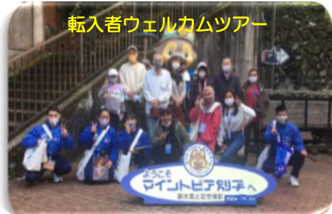
転入者ウェルカムツアー

高校生が自ら感じた本市の課題や要望をビジネスとして提案！官民連携で実現を目指す！