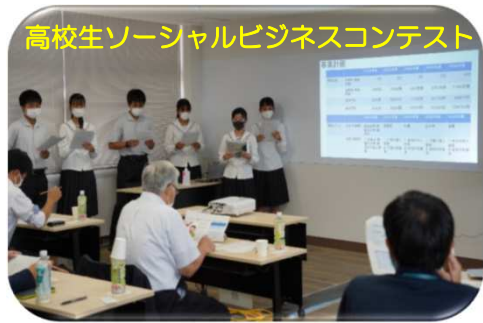
高校生ソーシャルビジネスコンテスト

高校生が自ら感じた本市の課題や要望をビジネスとして提案！官民連携で実現を目指す！