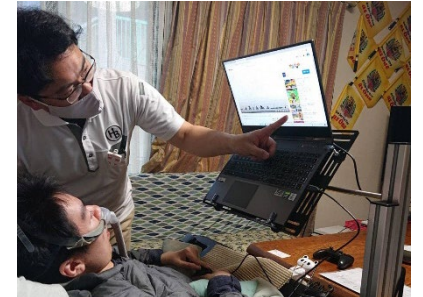
重度障がい者支援