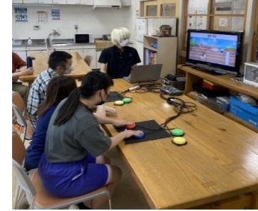
障がい者就労支援施設