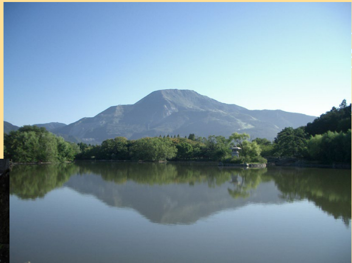
(左から) 琵琶湖、ゲンジボタル、梅花藻、伊吹山