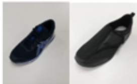
センサーシューズ