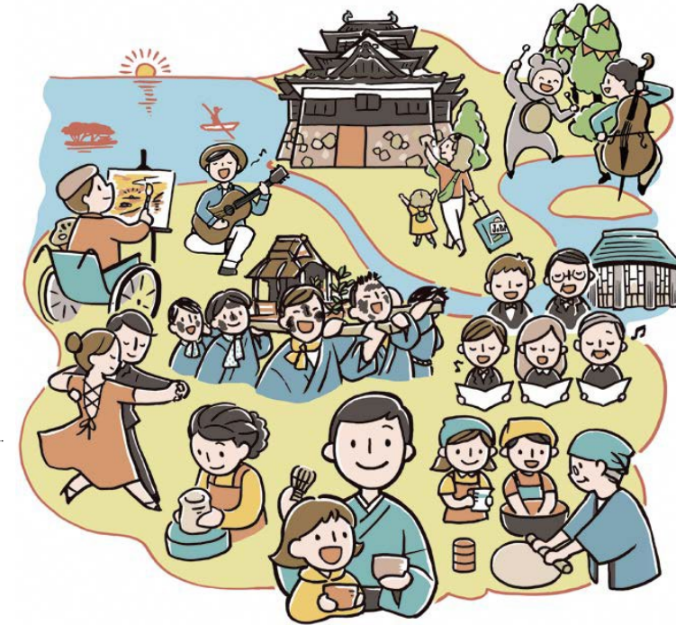
本市の目指す将来像