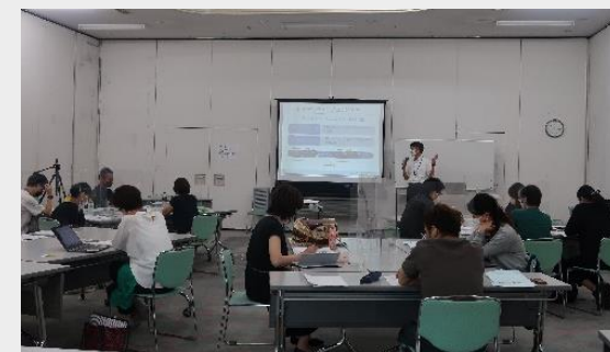
アクセラレーションプログラム受講風景