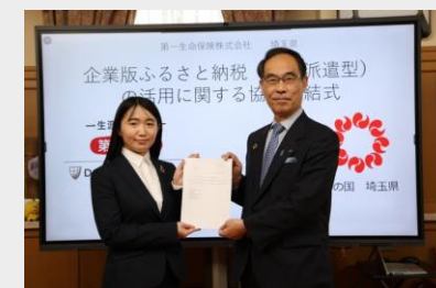
R5～受入開始 (埼玉版SDGsの推進)

地方創生に資するあらゆる分野の 事業 で人材受入を検討します。 ご相談をお待ちしております。