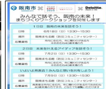
まちづくりワークショップ