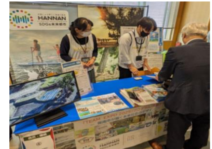
大阪・関西万博関連イベント