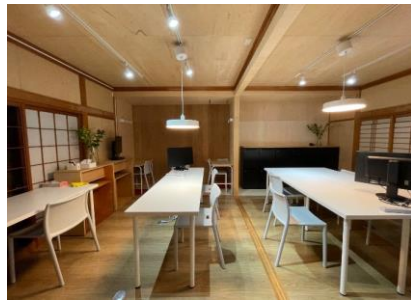
阪南サテライトオフィス