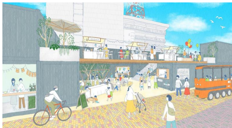
広島通り側から見た賑わいのイメージパース ©株式会社篠崎弘之建築設計事務所