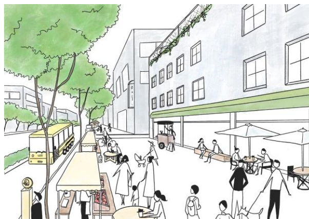
illustration : 合同会社カネック *内容及びイメージパースは現段階のものであり、今後変更の可能性がります