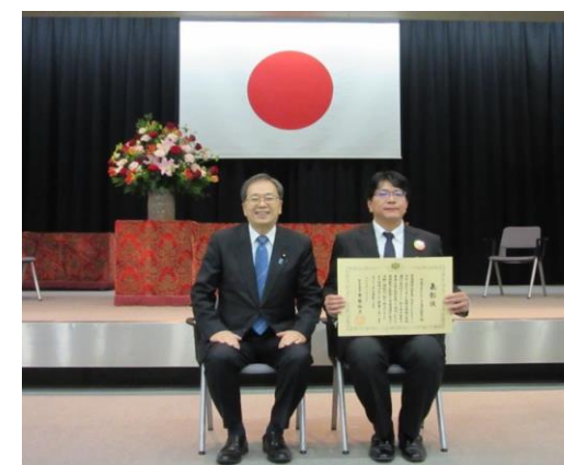
令和4年交通関係環境保全優良事業者等大臣表彰