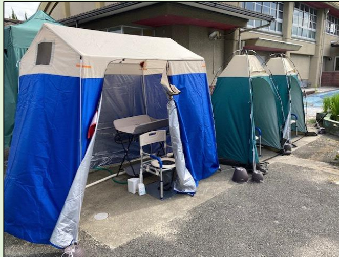
避難所となる小中学校へのマンホールトイレの設置