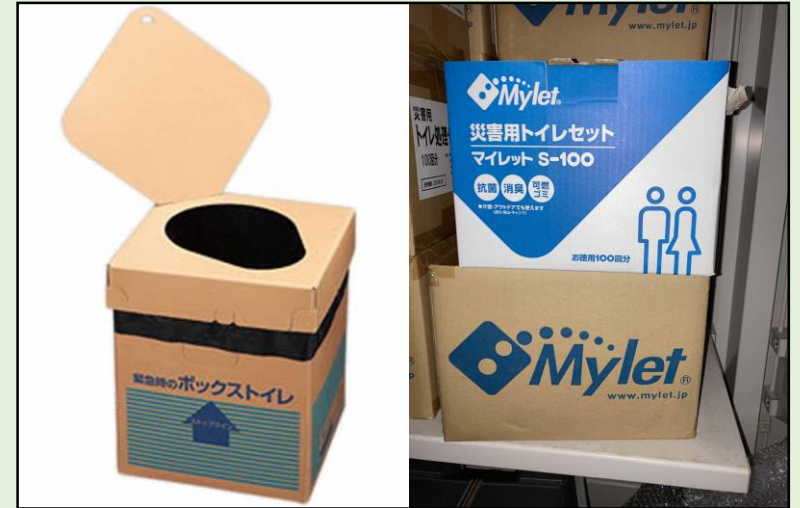
簡易トイレ及び凝固剤の備蓄