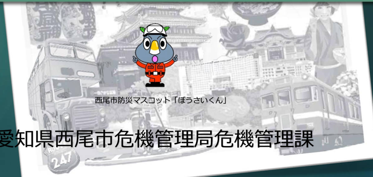
西尾市防災マスコット「ぼうさいくん」