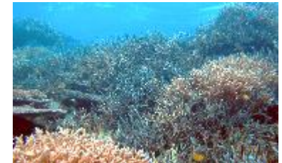
環境保全・適正利用