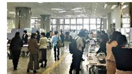
交流・連携イベント (SDGs展示会、セミナー)