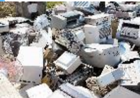
脱炭素・リサイクル イノベーション