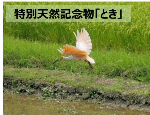
特別天然記念物「とき」