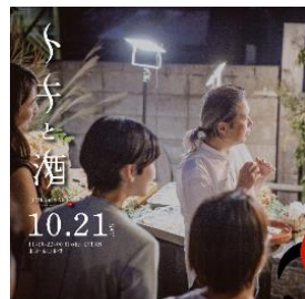
移住交流イベント、開催。 佐渡島の移住交流に関わるメンバーや地元企業、行政関係者が集まり、交流イベントを開催しました。