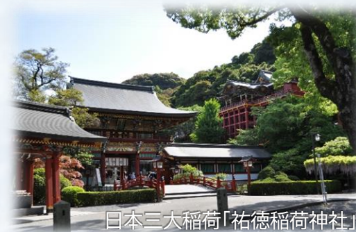
日本三大稲荷「祐徳稲荷神社」