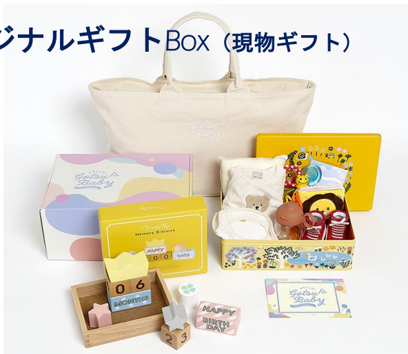
オリジナルギフトBox（現物ギフト）