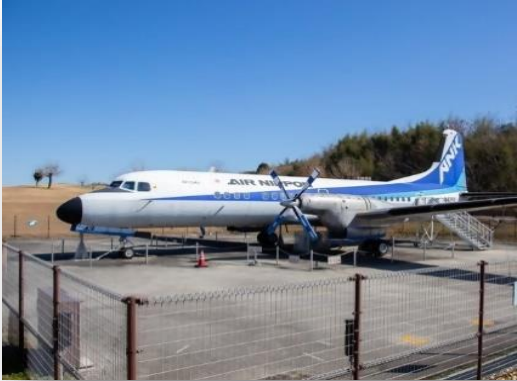
東ウイングエリア