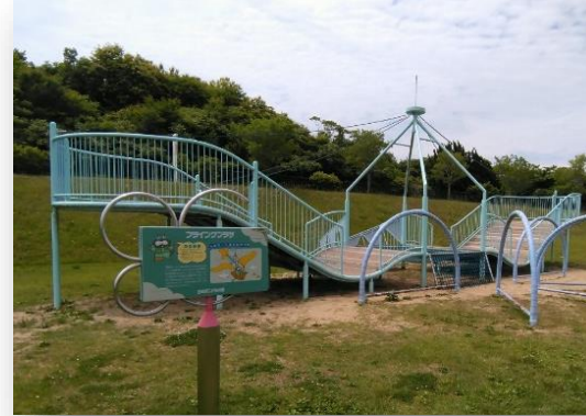
西ウイングエリア