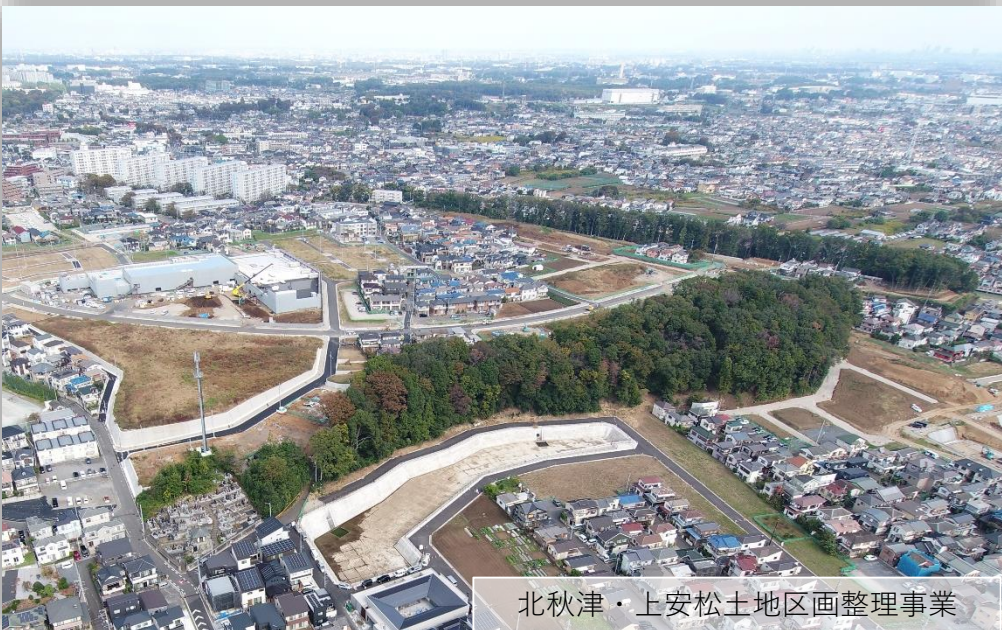
北秋津・上安松土地区画整理事業