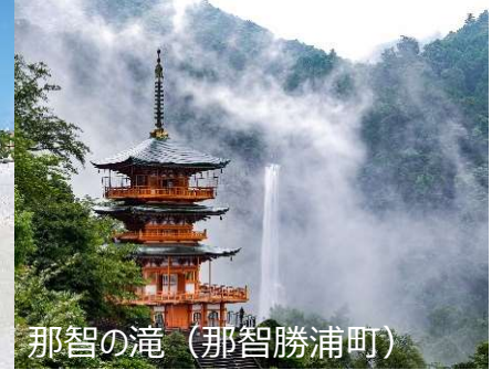
那智の滝 (那智勝浦町)