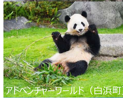
アドベンチャーワールド (白浜町)