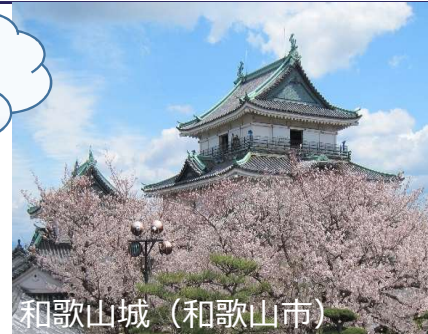
和歌山城 (和歌山市)