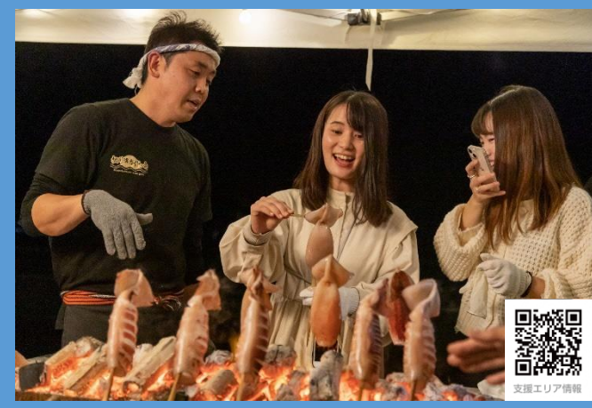
支援エリア：復活の浜焼き（相馬市）