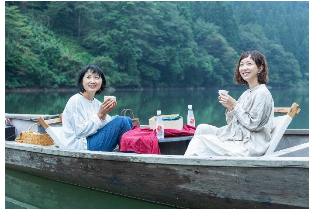
支援エリア：霧幻峡の渡し「水上の贅沢朝時間」（金山町）