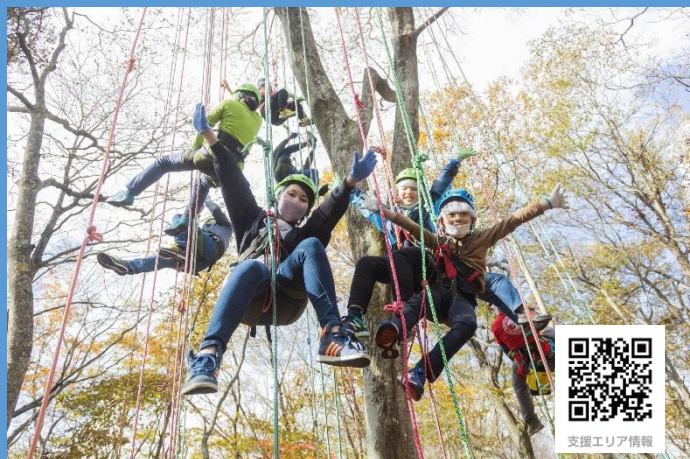
支援エリア：たむら里山あそび体験博「キャンぱく」（田村市）