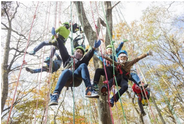
支援エリア：たむら里山あそび体験博「キャンぱく」（田村市）