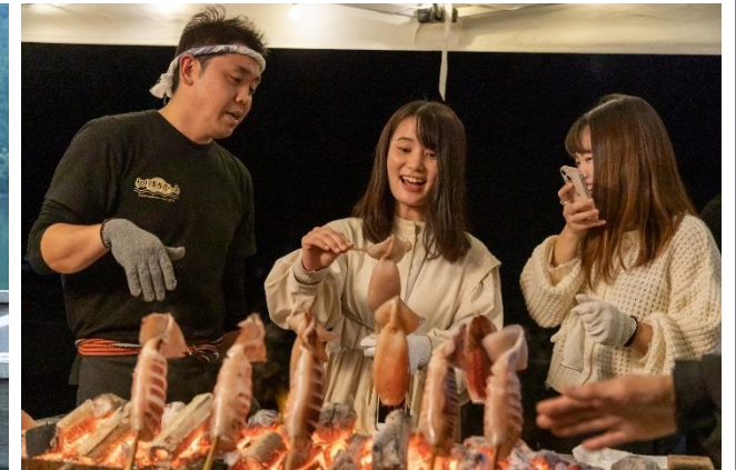
支援エリア：復活の浜焼き（相馬市）