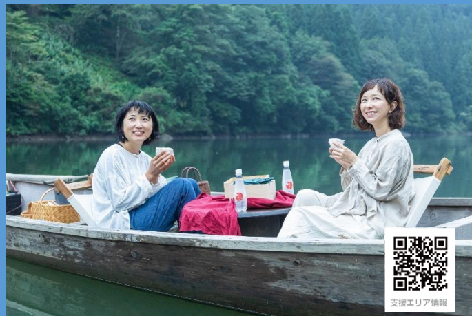
支援エリア：霧幻峡の渡し「水上の贅沢朝時間」（金山町）