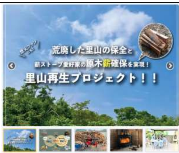
里山再生プロジェクト