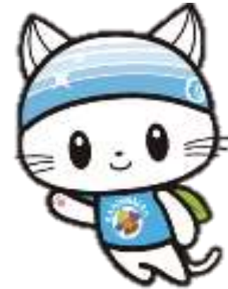
かすみがうら市公式キャラクター かすみがうにゃ