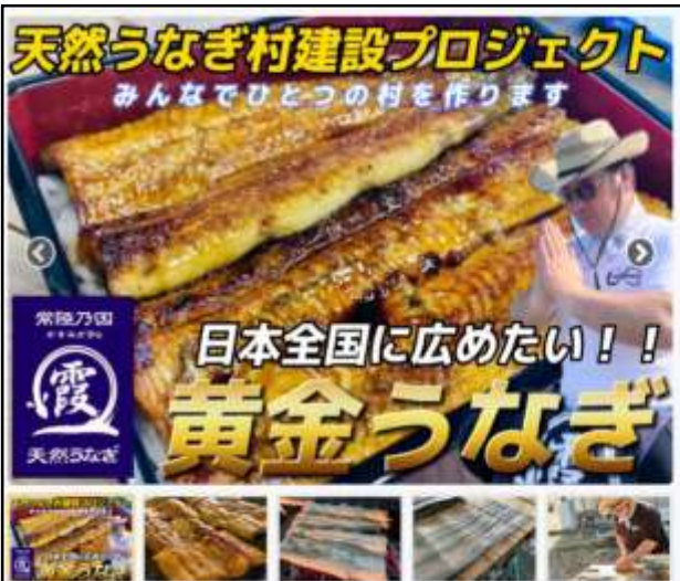
うなぎ村プロジェクト