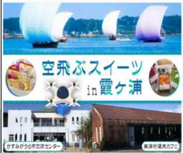
ドローンプロジェクト