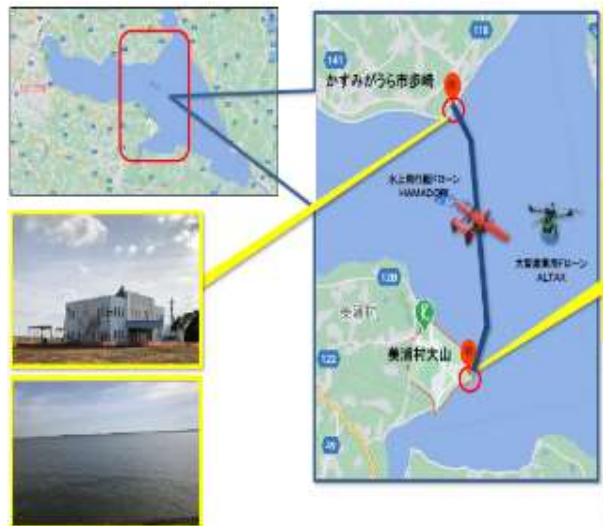
ドローン（物流・観光）