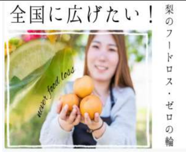
フードロス削減(梨ピューレ)プロジェクト