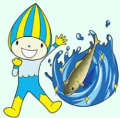
マスコット キャラクター ミナモ