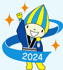
マスコット キャラクター ミナモ