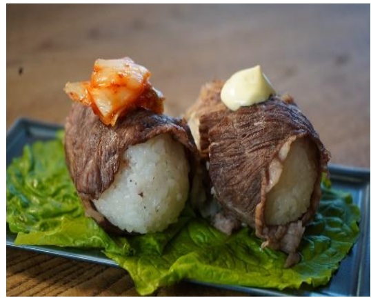
子どもたち考案商品