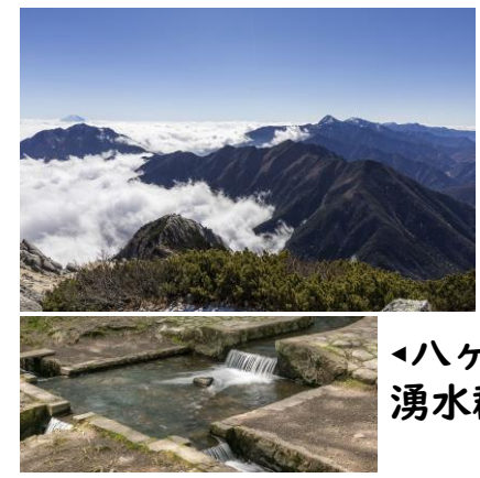
◀日本屈指の名峰が連なる景色