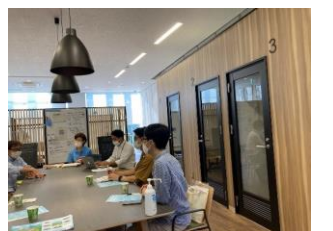
▲長坂コワーキングスペースの異業種交流会の様子