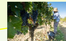
世界に誇るワイン産 地づくり