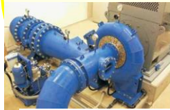
小型水力発電 「クリーンでんでん」