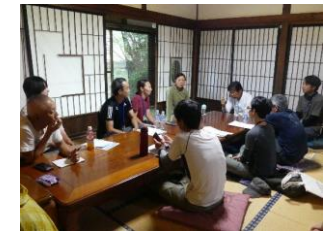
▲就農した先輩移住者との交流会

移住者・二拠点居住者・北杜ファンなどをはじめとする多様な主体の交流イベントや会議による協働・共創できる関係を構築