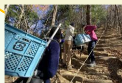
新たな登山道の 整備の取組