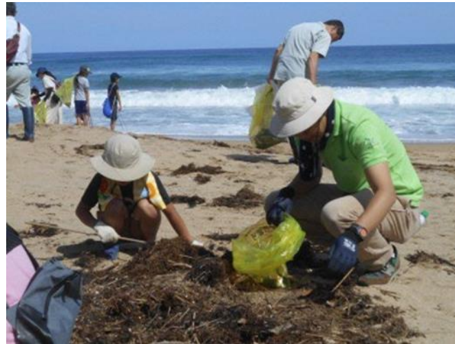
ビーチ一斉クリーン作戦の作業風景