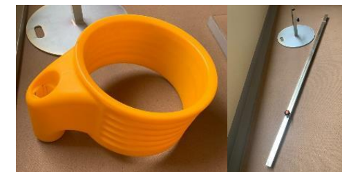
(写真) コーフボール競技イメージ、競技用具（左：ボール 中：コーフ 右：柱とベース）