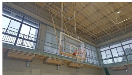
(写真) セーフガード、バスケットゴール