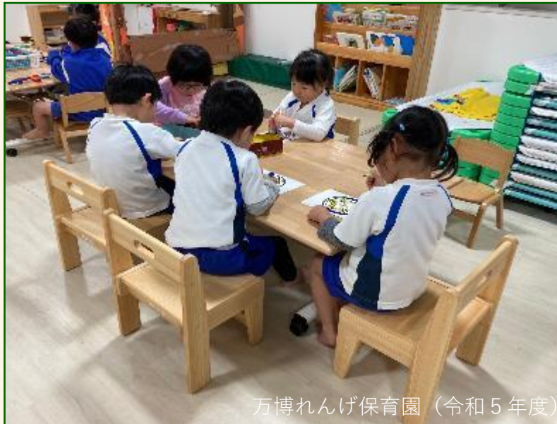
万博れんげ保育園 (令和5年度)

期待されています。 (政府広報オンラインHP「国産木材を利用して、日本の森林を元気に保ちましょう」より抜粋)