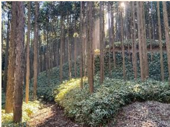
参考：間伐後の森林の様子