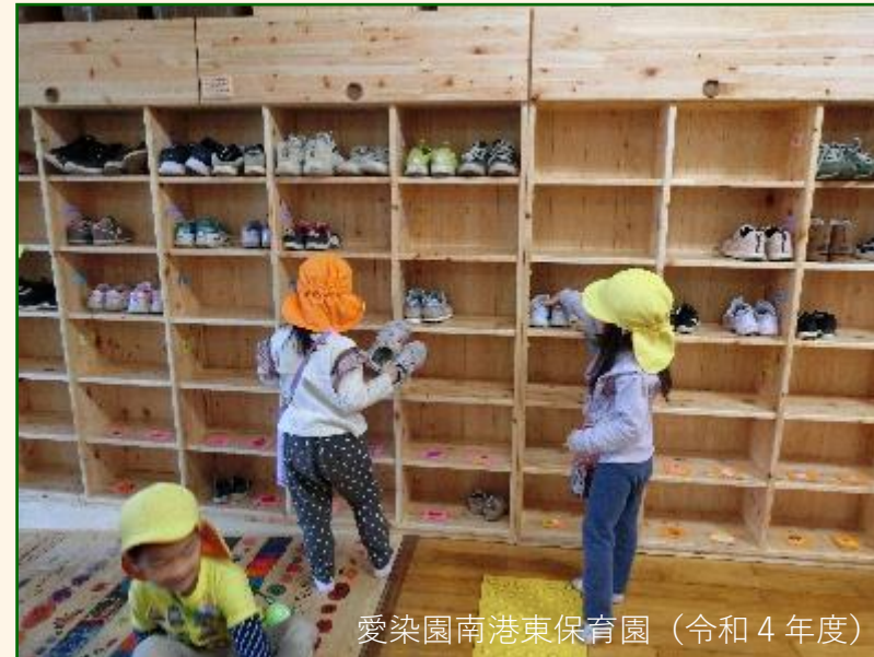
愛染園南港東保育園 (令和4年度)