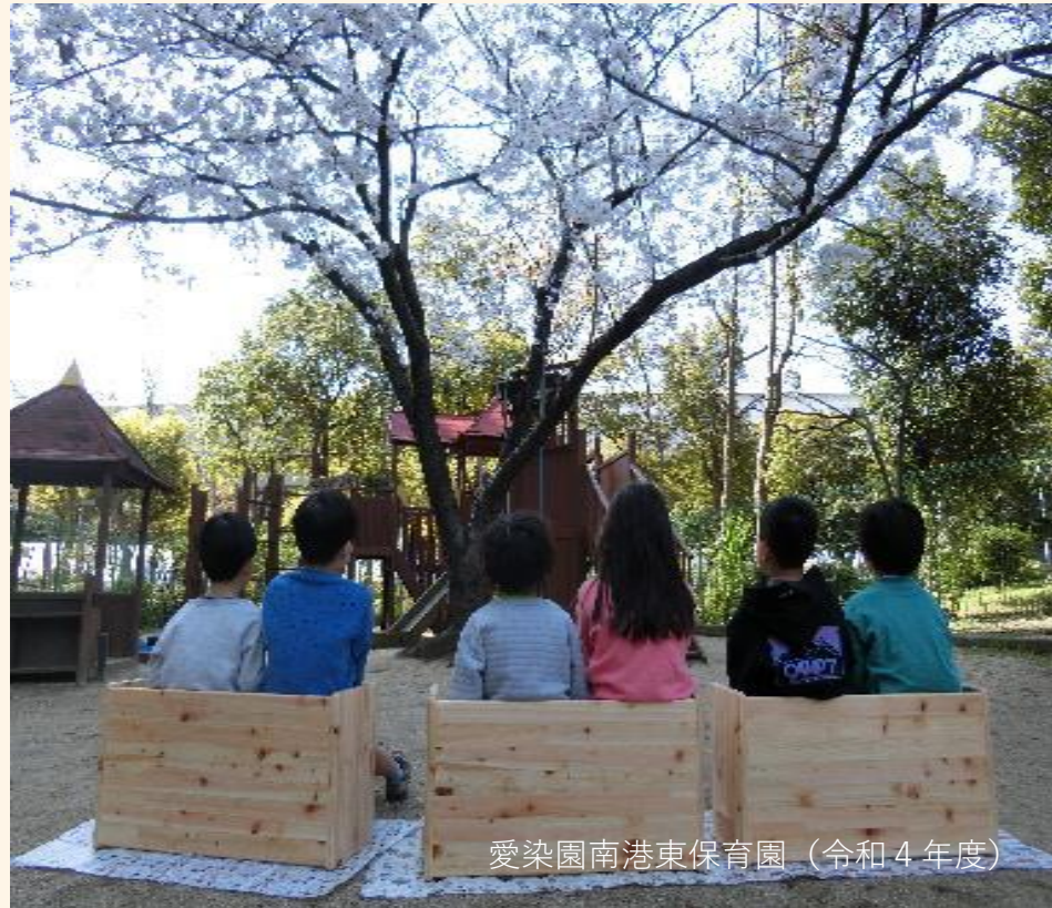
愛染園南港東保育園（令和4年度）