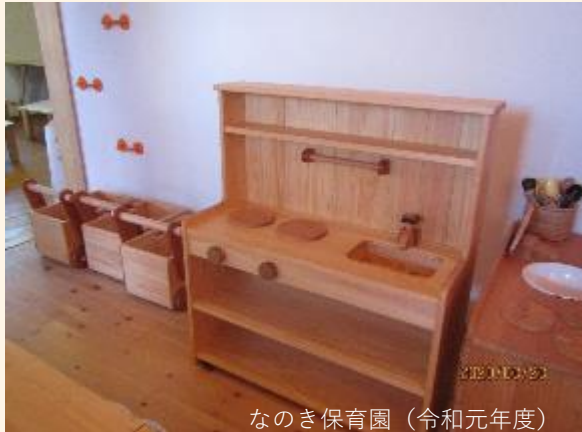
なのき保育園（令和元年度）