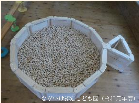
ながいけ認定こども園（令和元年度）

森林にはCO 2 を吸収し、炭素を固定化する機能があります。 この機能は、切られた後の木材やその木材に加工がされた後も 木材を燃やさない限り変わりません。 そのため、木製品は『炭素の缶詰』と呼ばれています。