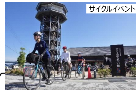
サイクルイベント

2018年度から2020年度まで、関西各地域で取組みが進められている各ルートを連携させ、自転車を活用した広域連携による賑わい創出など地域活性化を図り、まちづくりにつなげる社会実験を実施。