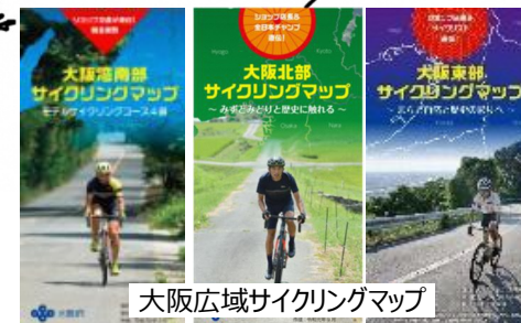
大阪広域サイクリングマップ