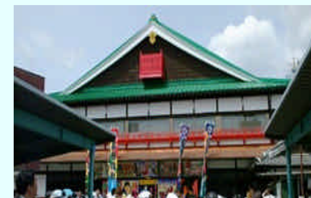
再興された嘉穂劇場と周辺商店街 (本年9月)