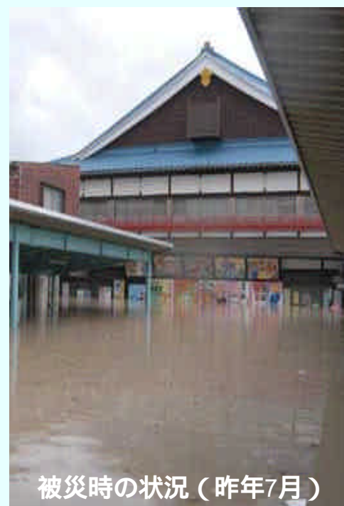
被災時の状況 (昨年7月)

集客力のある劇場と観客が回遊できる商店街の相乗効果を目指す。 全国からの支援・募金等により本年9月劇場再興 (こけら落とし)