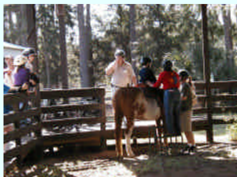
モデルは、米国のポールニューマン財団が主宰する「The Hole in The Wall Gang Camp」