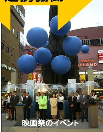
映画祭のイベント