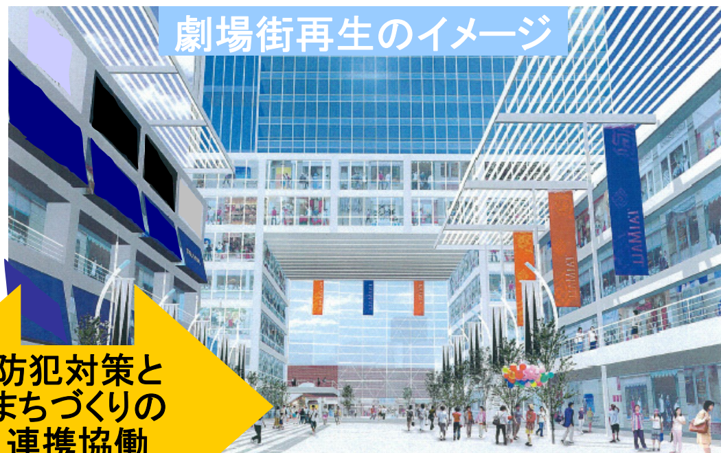
劇場街再生のイメージ