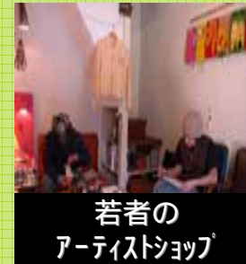
若者のアーティストショップ