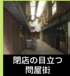
閉店の目立つ問屋街

河原町は、ほとんど空き店舗だったが、「路地見て一杯」というイベントをきっかけに若者が集まり、出店。モデル調査やフリーマーケットなどにより、 20店舗以上の集積 。