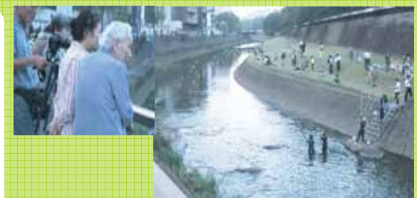
「まち」に意識を向ける

60年ぶりに精霊流しを復活。 市民の会を作って、参加費を徴収し、企業協賛も募る 。行政の河川利用に対する 姿勢も変わり 、会場準備、受付、灯籠を流すボランティアダイバー、流した灯籠の清掃等、 地域全体が協力して取り組んだ 。