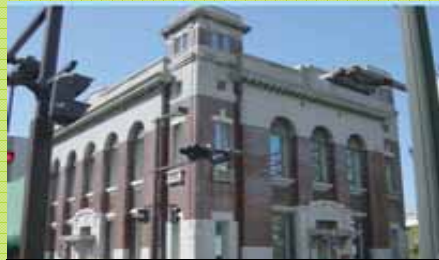
第一銀行熊本支店

熊本まちなみトラスト設立のきっかけとなった旧第一銀行熊本支店。室内空調のショールームとして再生。