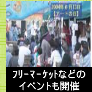
フリーマーケットなどのイベントも開催