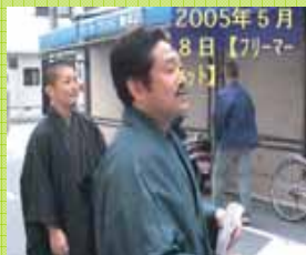
地域の「旦那衆」を目指す

若者の動きに刺激され、新たな組織を立ち上げ、地域の「旦那衆」となることを目指して、和服姿に、「おてもやん」のルーツ探訪など、 若者との連携により、活動の担い手の裾野を広げる 。