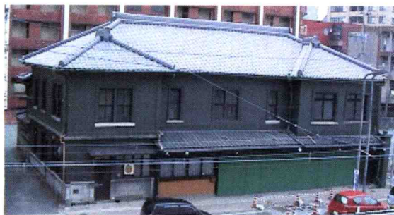
後藤商店 1920（大正9）年建造 2005年改装 熊本市景観形成建造物