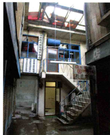
河原町繊維問屋街 1958（昭和33）年建造 ※「記憶の継承」への予期せぬ 参加者達によって 平成15年度全国都市再生モデル調査 に採択