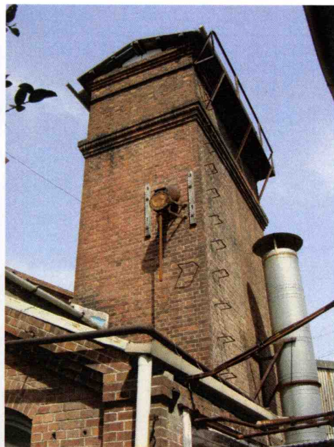
熊本紡績工場として 1894（明治27）年建造 2003年解体 2004年一部（2棟）移築活用 2棟とも登録文化財