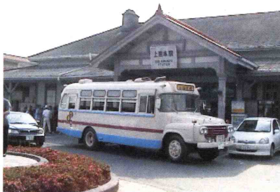
JR上熊本駅舎 1913（大正2）年建造 2005年解体 2005年隣接地に移築保存決定