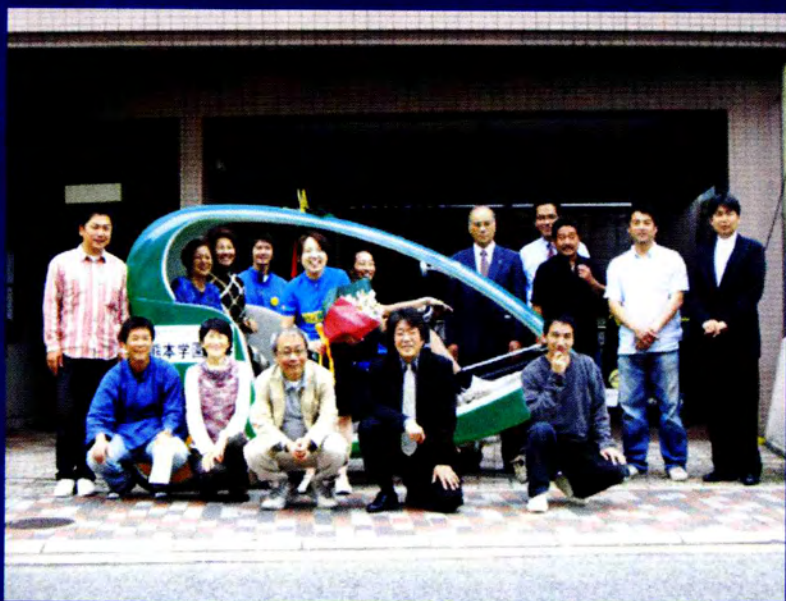
ご近所の方達が集まっていただきました

運営主体であるNPO熊本ホスピタリティネットワークを熊本まちなみトラストが支援しています