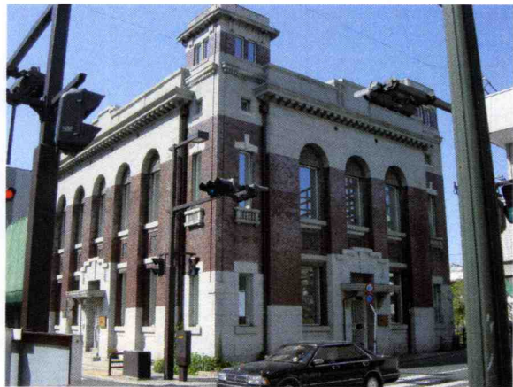
第一銀行熊本支店として 1919（大正8）年建造 PSオランジュリとして 2000年改装開業 登録文化財／熊本市景観形成建造物

20世紀初頭の建造物を 都市の遺伝子として22世紀まで語り継ぐこと。 ありふれた奇跡として。