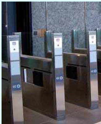
セキュリティーゲート