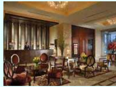
サービスアパートメント