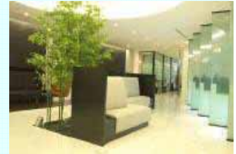
世界的な医療機関と提携した病院