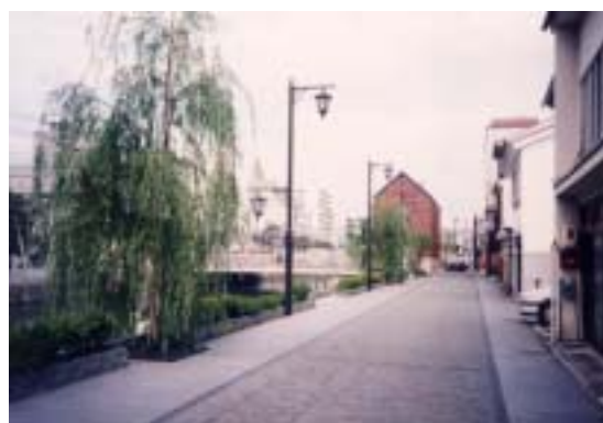
松江堀川沿いの市街地