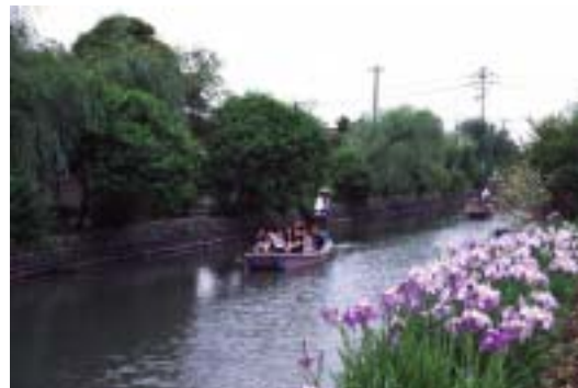
あやめの美しい初夏の柳川