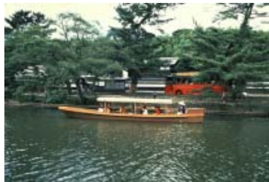
塩見縄手とよばれる街道と遊覧船