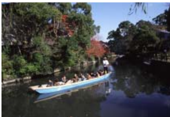
市民の手で浄化された堀割を進むどんこ舟