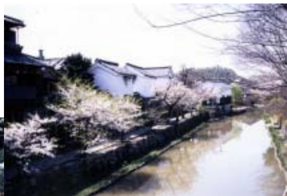
整備後の白雲橋付近