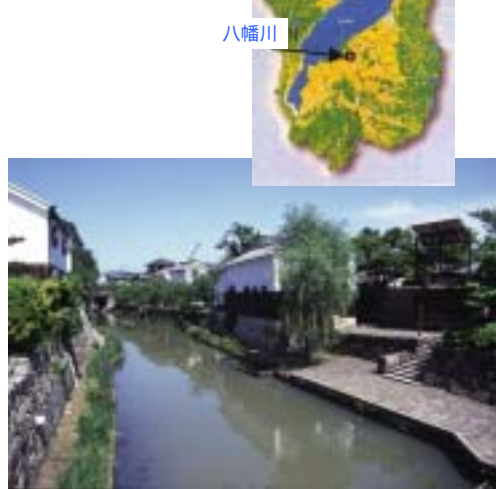
美しく再生された八幡堀の風景