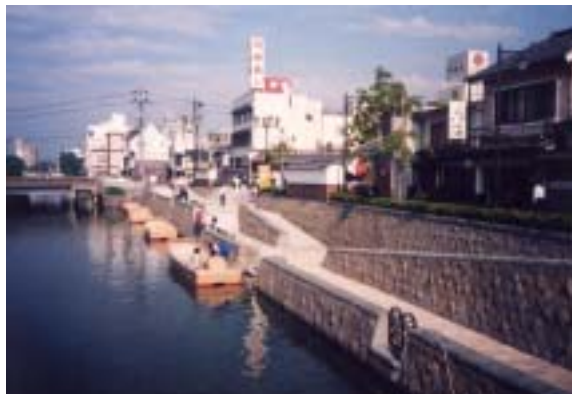
松江堀川の船着場(カラコロ広場乗船場)