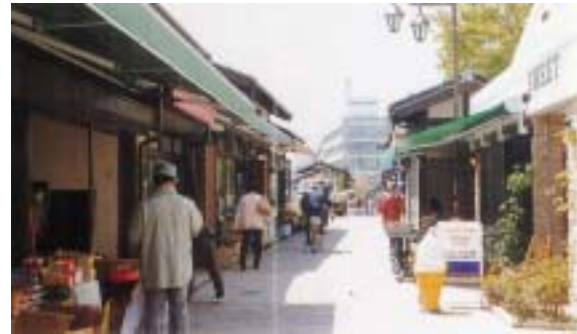
なわて通り入り口