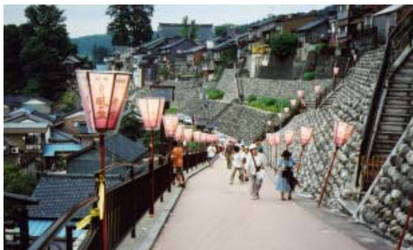
「八尾曳山祭」や「おわら風の盆」で全国に知られる「坂のまち“八尾”」を象徴する景観を地域住民等と共に創出