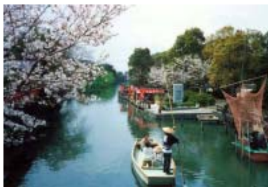
どんこ舟と船着場