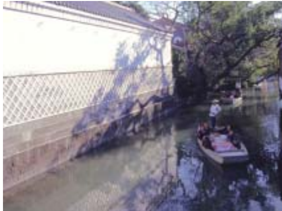
白壁の町並みとこたつ舟