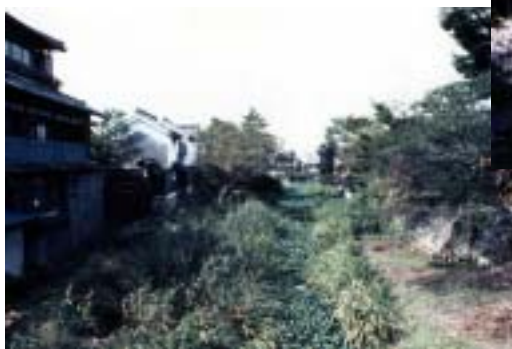
整備前の様子(白雲橋付近)