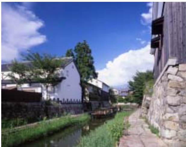
八幡堀と白壁土蔵の調和した景観