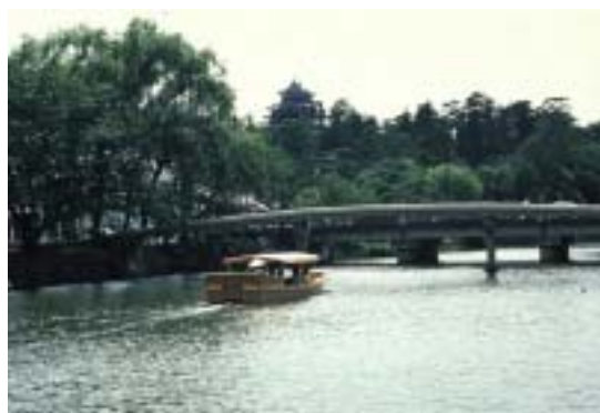
堀川遊覧船と松江城