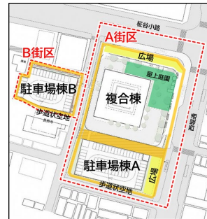
施設配置イメージ