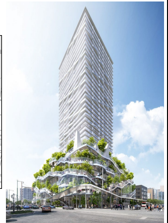
施設外観イメージ