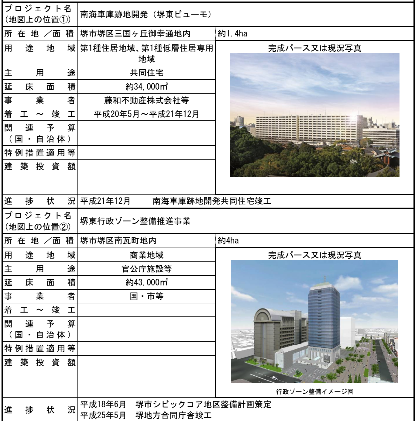
行政ゾーン整備イメージ図