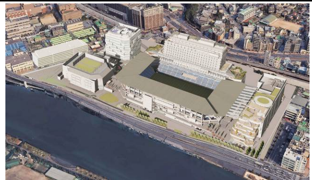
※施工段階のため今後デザイン含め変更の可能性があります。