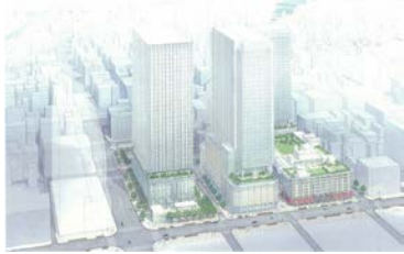
日本橋二丁目地区(東京都中央区) 容積率:800%、700% → 1990% 等

都市再生に貢献し土地の高度利用を図るため、都市再生緊急整備地域内において、既存の用途地域等に基づく規制にとらわれず自由度の高い計画を定めることにより、容積率制限の緩和等が可能。