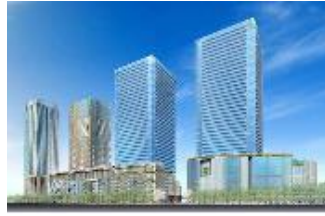
大阪駅北地区（大阪市） 容積率：800% → 1600% 等