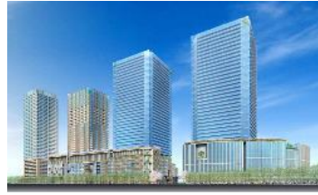
大阪駅北地区(大阪市) 容積率:800% → 1600% 等