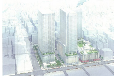
日本橋二丁目地区（東京都中央区） 容積率：800%、700% → 1990% 等

都市再生に貢献し土地の高度利用を図るため、都市再生緊急整備地域内において、既存の用途地域等に基づく規制にとらわれず自由度の高い計画を定めることにより、容積率制限の緩和等が可能。