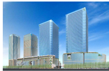
大阪駅北地区（大阪市） 容積率：800% → 1600% 等