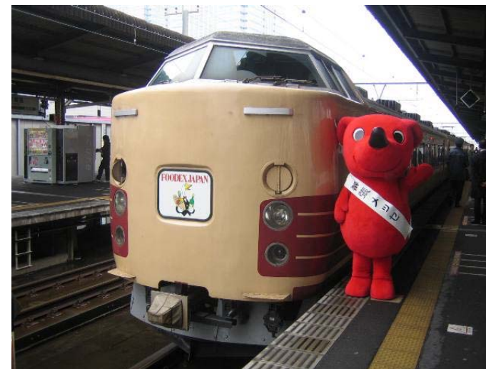
りんかい線～京葉線の臨時直通列車を運行