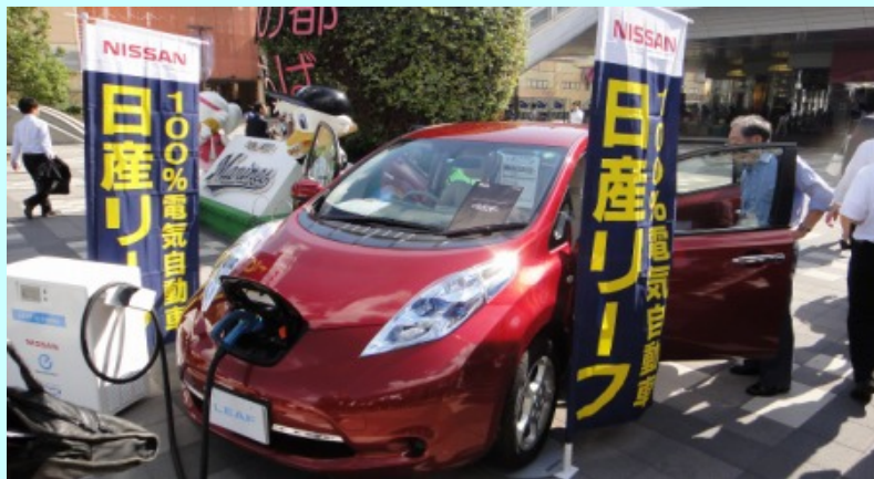
CEATEC JAPANの開催にあわせ、海浜幕張駅前に情報発信拠点を設置