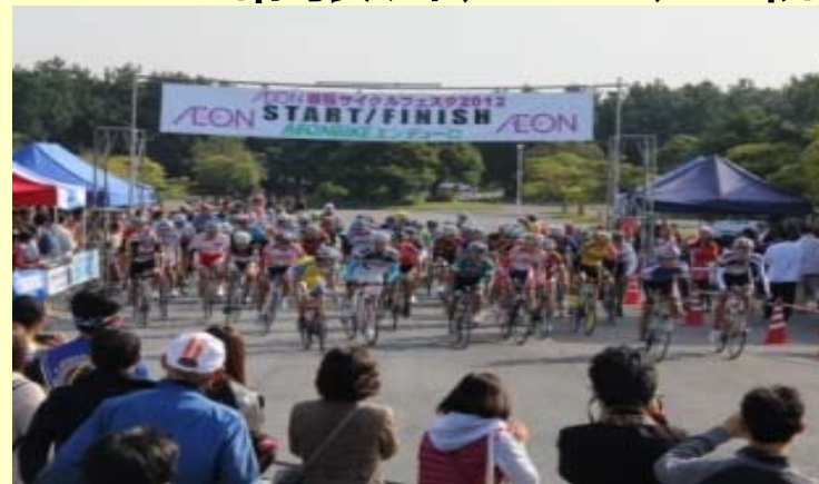
CYCLEMODE INTERNATIONALの開催にあわせ、隣接する幕張海浜公園において自転車イベントを開催