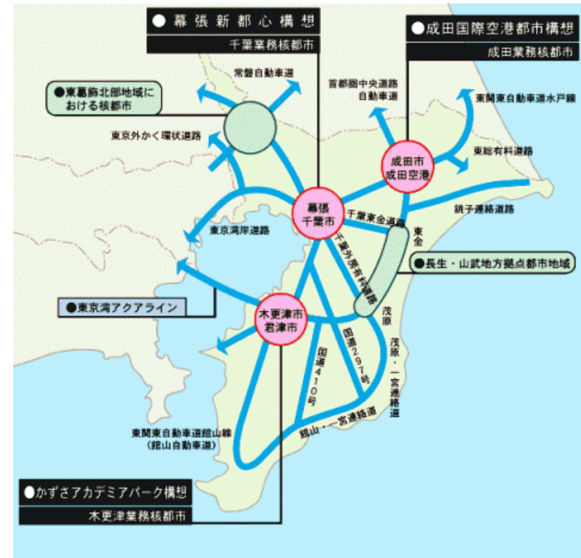
千葉新産業三角構想(昭和58年6月策定)