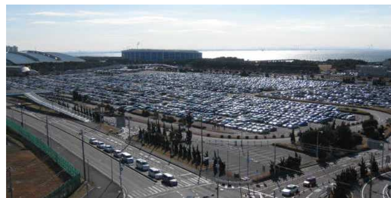
国内のコンベンション施設では最大級・5,500台の常設駐車場