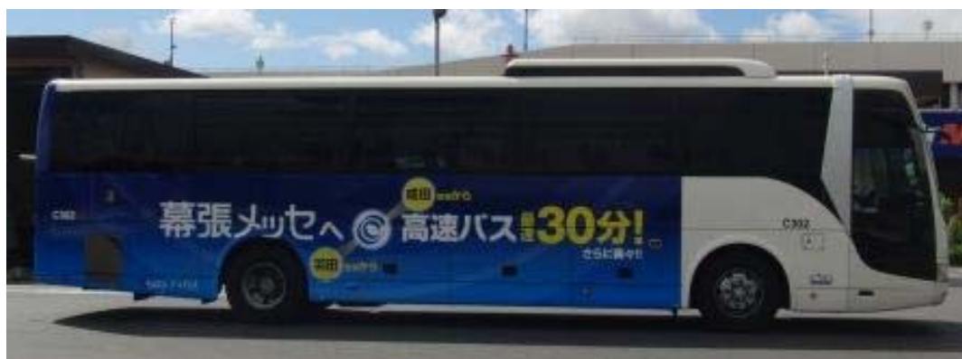
幕張メッセと羽田空港・成田空港をそれぞれ 最速30分で結ぶ高速バス